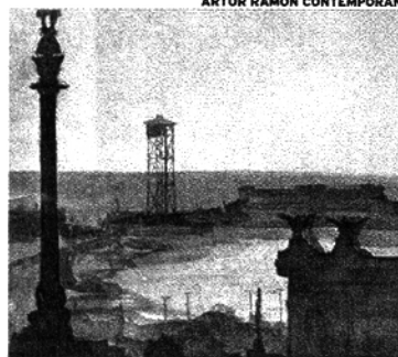
ARTUR RAMON CONTEMPORANI

els conjurs que amb ossos d'animals es poden fer en un gran recipient de bronze que sona com una campana; en els continents africà i hindú; i també en els retrats íntims de les sibil·les, antigues i contemporànies, que interpreten el passat en funció del futur que ningú sap com és i que elles intueixen. En recomano la visita.